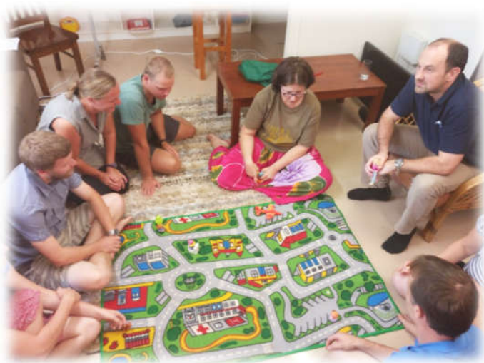
Heel praktisch de taal leren: ik loop naar de winkel....

We hebben een tweeweekse cursus gevolgd over de taal en cultuur van Yolngu (de Aboriginals in Arnhemland). Het is fijn om de tijd te hebben meer over hun cultuur te weten te komen en eerste stapjes te zetten in de taal die hier gesproken wordt. Tegelijkertijd beseffen we hoe weinig we weten en begrijpen van deze cultuur die in zo ontzettend veel dingen compleet het tegenovergestelde is van wat wij gewend zijn.