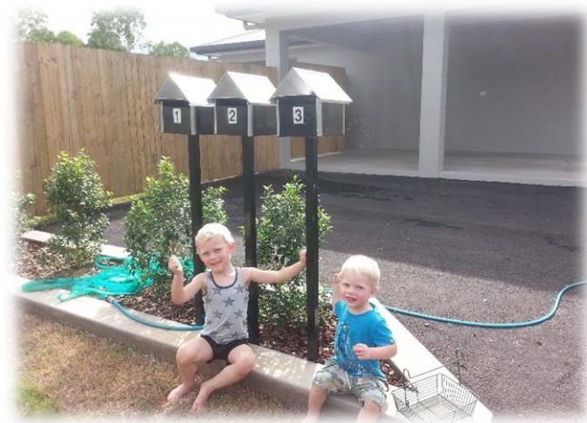
Wachten tot papa weer thuis komt van zijn training

Op 5 januari 2017 zijn we aangekomen in Cairns, Australië en werden we naar ons huisje in Mareeba gebracht. Een huisje met complete inboedel en de koelkast vol geladen. Een warm welkom vanuit MAF!